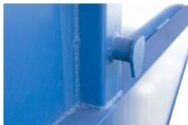
Захват варен в пластину 8мм