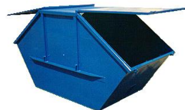
Закрытый с двумя крышками