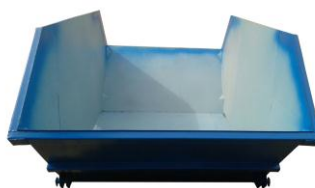
Сторона выгрузки усилена швеллером Углы усилены изнутри накладками