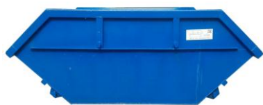
Цельный лист, сплошные швы